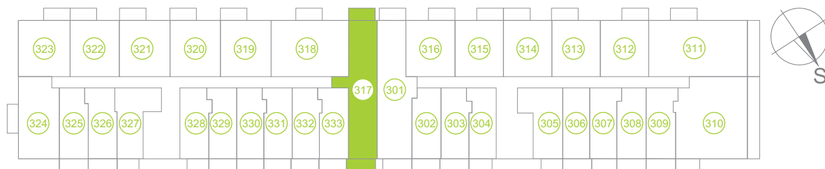
Půdorys podlaží / Floor plan