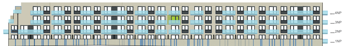
Jižní pohled na dům / Building View - south side